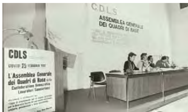
Alcune fasi dell'Attivo Generale dei Quadri presso il Palazzo dei Congressi per dibattere le linee di orientamento sulla riforma dell'ISS.

Inoltre anche la formazione professionale stava marciando per conto proprio senza incidere nei meccanismi della occupazione e produzione qualificata. 311