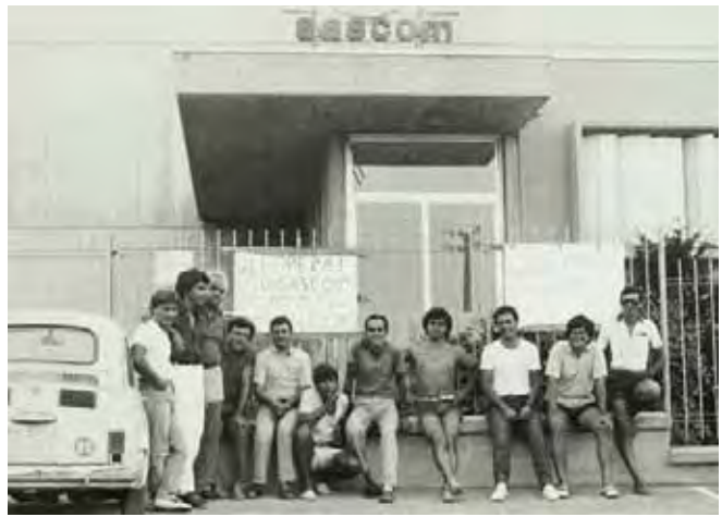
Un'immagine dell'ingresso della SASCOM, a Dogana, "picchettato" per settimane al fine di evitare lo smantellamento del magazzino prima degli accordi sulla ristrutturazione aziendale.

"È questo il modo con cui il governo intende impostare i rapporti con le forze