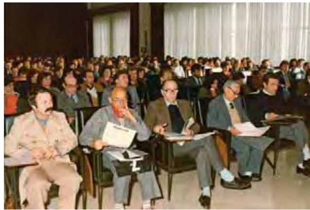
Palazzo dei Congressi: delegati seguono il dibattito congressuale.

La contrattazione aveva ottenuto molto (difesa salario reale, miglioramenti dell'orario di lavoro, diritto allo studio con aumento