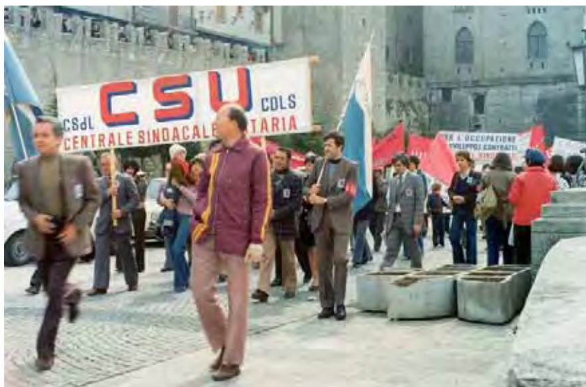
1° Maggio 1986.

Si era corso ai ripari introducendo nuove "Norme a sostegno delle attività produttive", 354 che avevano favorito l'insediamento in territorio sammarinese di parecchie aziende medie e piccole grazie alle agevolazioni fiscali offerte, imprese che in larga parte avevano riassunto molti lavoratori licenziati dalle altre aziende, tuttavia la CDLS continuava ad essere dell'avviso che tutto accadesse in maniera sempre abbastanza contingente e casuale, senza adeguata programmazione industriale ed economica, 355 polemica che sarà una costante anche degli anni successivi, come d'altronde lo era stata negli anni precedenti.