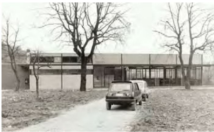
La mensa di Faetano in via di ultimazione.

Altra iniziativa del 1980, che interessa l'argomento del presente studio, fu l'illustrazione in Consiglio di un progetto di legge sulle cooperative di abitazione, che cercava di aiutare quei cittadini desiderosi di farsi una casa, ma con scarsi mezzi economici a disposizione.