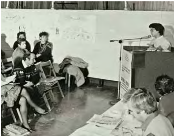
A lato: rilancio dell'occupazione, sanità e formazione sindacale al centro dell'Assemblea generale dei Quadri (15 novembre 1983). Iniziativa preparatoria al 7° Congresso.

Era ormai maturo il tempo per superare gli atteggiamenti settari verso il sindacato e per realizzare un "patto sociale" mirante a risolvere il problema dell'occupazione tra governo, che doveva abbandonare le "velleitarie pretese di imporre unilateralmente le logiche del potere, del rigore a senso unico, del rifiuto del confronto aperto e leale", padronato, che doveva togliere il "paraocchi del profitto immediato per guardare le scelte in una prospettiva più ampia", e sindacato stesso, a cui spettava "muoversi con l'agilità indispensabile per essere protagonista attivo del necessario processo di rinnovamento e