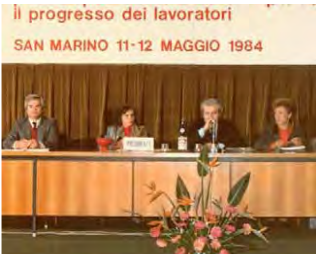
Come superare la crisi occupazionale che attanagliava il Paese a metà degli anni '80? Questo il tema di fondo del 7° Congresso.

Nel settore pubblico era prioritaria la contrattazione relativa allo stato di diritto.