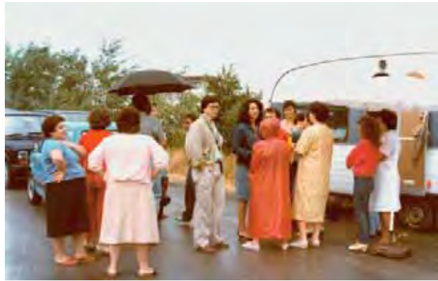
Presidio davanti all'ASCOT, azienda tessile di Chiesanuova con oltre 100 dipendenti.

A parte questo specifico confronto col governo, che diede risultati ritenuti soddisfacenti, in genere il sindacato non era contento dei rapporti che intercorrevano col massimo organo politico dello Stato, come d'altra parte abbiamo già visto esaminando quanto detto durante il VII congresso. "All'interno del governo sta prendendo corpo l'obiettivo di "governare" senza tener conto delle parti sociali e delle espressioni organizzate dei lavoratori", fu detto sempre su "Proposta Sindacale" del mese di luglio, in quanto si cercava "con ogni mezzo possibile di snaturare il ruolo contrattuale del Sindacato non dando soluzione agli impegni assunti con lo stesso".