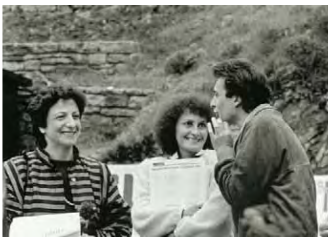
Distribuzione di “Proposta Sindacale” durante un 1° Maggio degli anni Ottanta.

La riforma delle pensioni era ritenuta una necessità urgente, perché il sistema pensionistico sammarinese era cresciuto disorganicamente, spesso con interventi contraddittori tra loro e con l'originario sistema di sicurezza sociale. La gestione del fondo era poi completamente da rivedere. Il governo a fine legislatura aveva presentato un progetto di legge, in seguito ampiamente rivisitato dalle organizzazioni sindacali per una serie di critiche che gli venivano mosse legate in particolare a certi privilegi che lasciava inalterati. 327